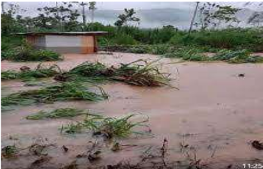
En la columna de fotografías se observa: El desborde del Río Chavini afectando a las viviendas y áreas de cultivos.