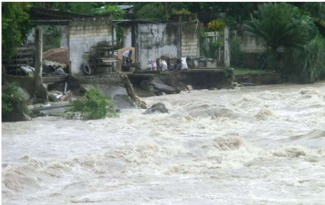
En la columna de fotografías se observa: Río Chavini que se requiere realizar la descolmatación y conformación de talud con material propia del río